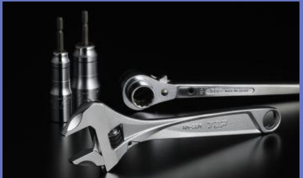
作業工具総合ブランド