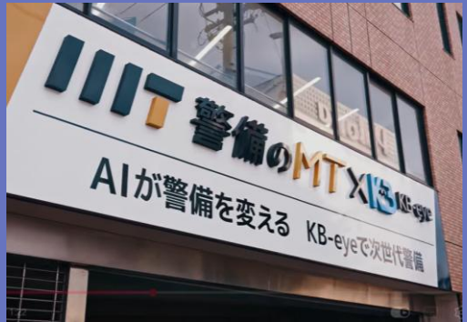
本社ビル設置の交通誘導AI看板