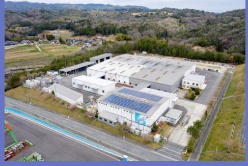
久井工場（広島県三原市）