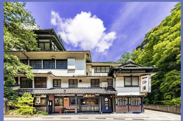
創業1630年の文化財旅館「一の湯本館」