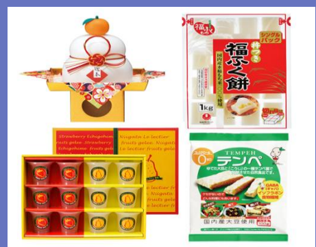
主力製品（餅・デザート・総菜）