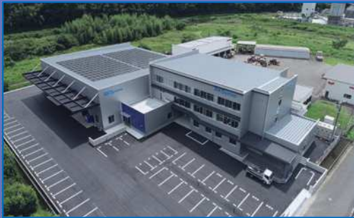
AKシステム 本社工場