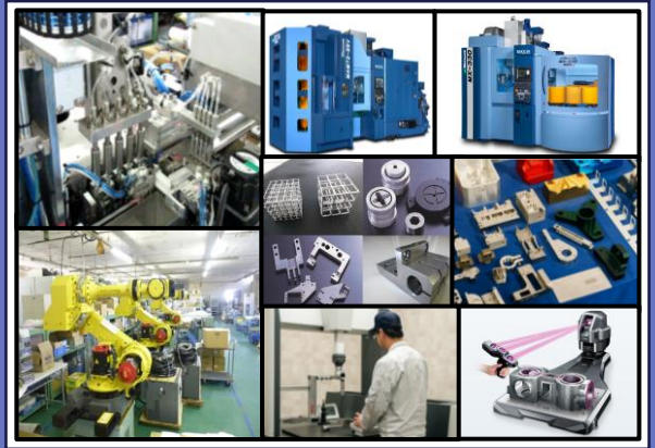
多種多様な省力化自動機製作・精密部品加工