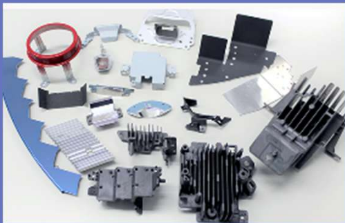
自動車のヘッドランプに使われる部品を主に扱っています