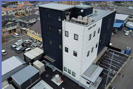
本社工場 (広島県三原市新倉2-6-14)