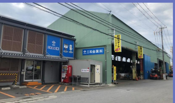
三和金属 浦添本社