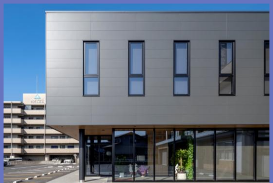
株式会社大和電業社 本社