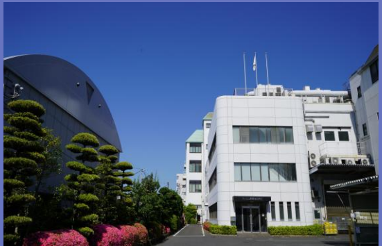
オーエム産業本社