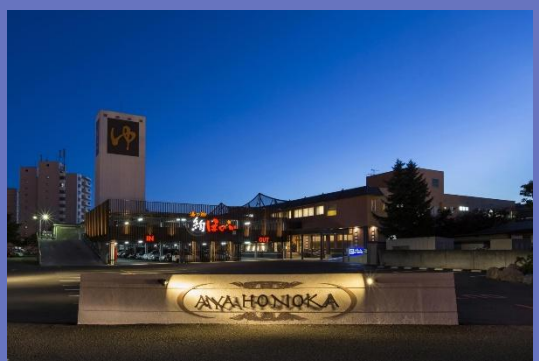
札幌市清田区 湯の郷 絢ほのか