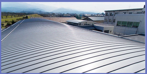
製品の一つ(金属製屋根材)