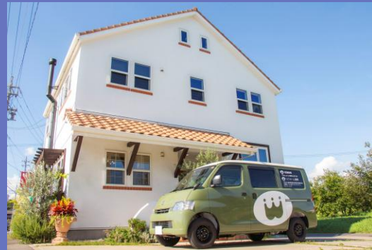
株式会社平松建工 本社