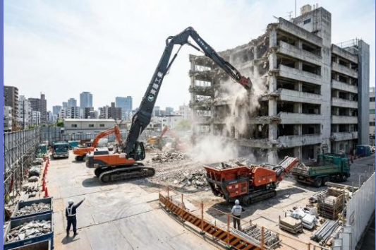
主力商品 (解体・産廃)