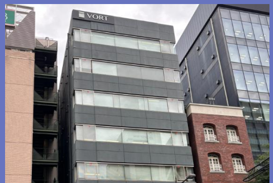
本社入居ビル（VORT東日本橋）