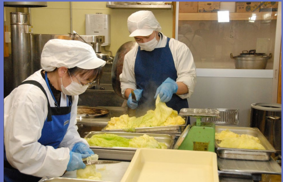
そうざい製造加工場