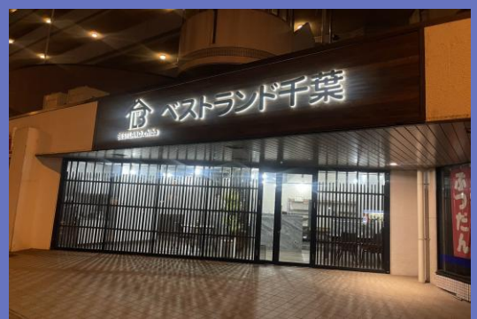
出洲港事務所外観写真