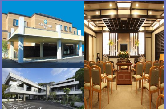
葬祭会館:ベルモニー会館勅使 結婚式場:アナザースタイル