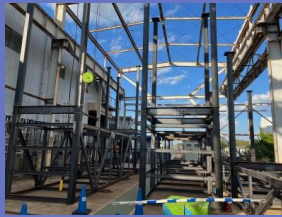
施工実績_タンク螺旋階段製作/配管ラック製作