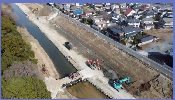
主力事業 土木工事業