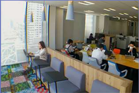
東京オフィス（浜松町）