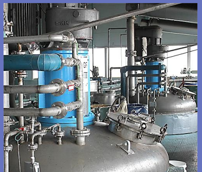
合成樹脂エマルジョン製造設備