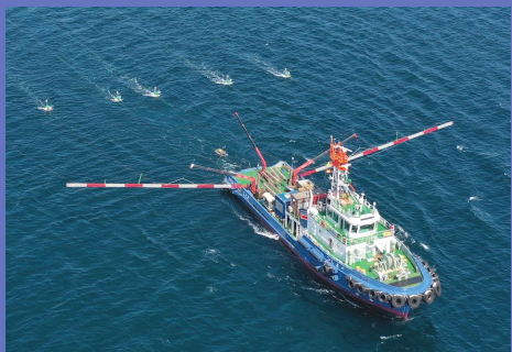
所有船舶による海洋調査支援