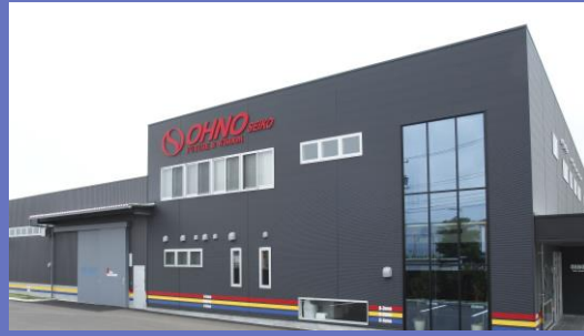
グループ会社 大野精工株式会社 本社 工場

私たちOGFグループは、単なる規模の拡大ではなく、地域社会への貢献度を最大化し、労働条件を整えて、社員一人ひとりが誇りを持って挑戦できる環境を強固にすることで、売上高100億円を目標に掲げて行動して参ります。「農・福・工」の連携を深化・加速させ、唯一無二の企業グループとして成長・発展を実現していきます。