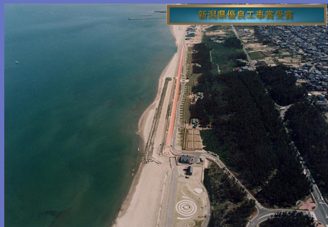
新潟県沿岸工事事業