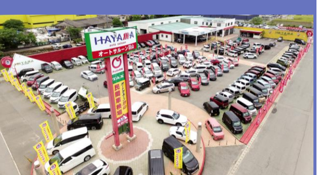
オートサルーン羽山本社展示場