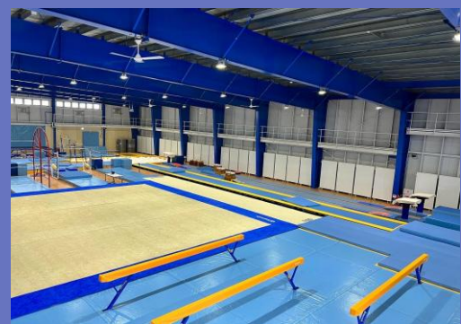
道内最大級の体操専用体育館

自社運営の体操クラブ又はボルダリングジムと児童デイサービスの複合施設を2032年度までに10施設増やす。 FC事業に関しては加盟店を10社に伸ばす事を目標にする。 人材紹介部門で成果報酬型求人サイトを2027年4月までにリリース