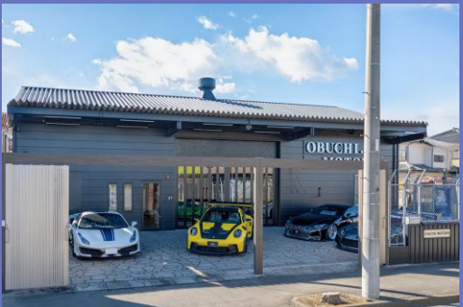
本社ショールーム