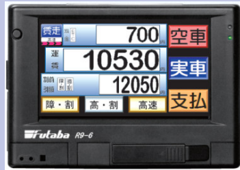
当社製品「タクシーメーターR9-6」