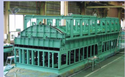
商用施設屋根製品用型枠