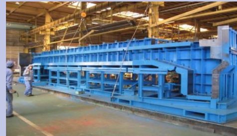
橋梁向け製品用型枠

お客様の幅広いニーズに対して、全国7工場(岩手、秋田、埼玉、千葉、岐阜、大阪、福岡)が連携して、ご満足いただける製品とサービスを全力でお届けします。