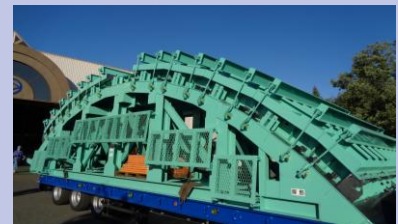
防雪シェルター製品用型枠