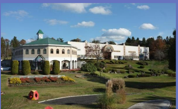
花泉工場 (岩手県一関市)