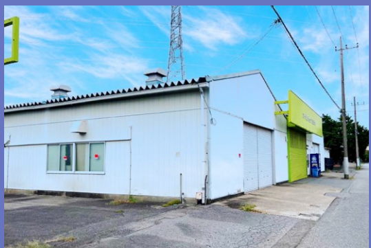
EBC株式会社 つくば工場