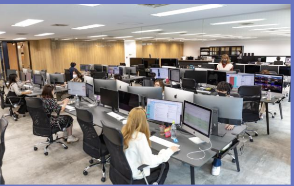
本社（コールセンター）