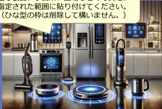
主力商品 家電製造

主な製品、事務所、工場などの写真を、 指定された範囲に貼り付けてください。 (ひな型の枠は削除して構いません。)